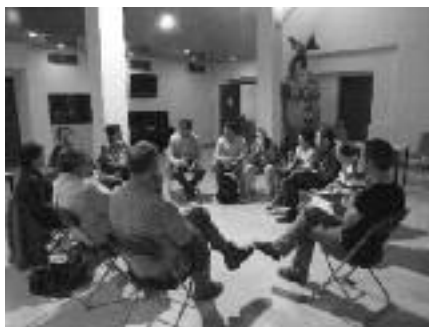
Una de les sessions de treball amb entitats que es van fer al Mundial.

El procés participat ha consistit a fer enquestes a totes les entitats de la Bisbal que ho han volgut, s'han fet enquestes en profunditat a persones conegudes del món associatiu bisbalenc i als representants dels grups polítics, i s'han dut a terme dos grups de treball amb responsables de les entitats bisbalenques.