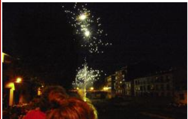
Festa Major. Tronada. Un dels moments més espectaculars de la Festa Major va ser la Tronada que es va fer al Illit del Daró entre el pont Vell i el pont Nou, just abans de començar la Promenade du Dragon. Va ser un moment breu però molt intens que va congrega centenars de persones al voltant del riu.