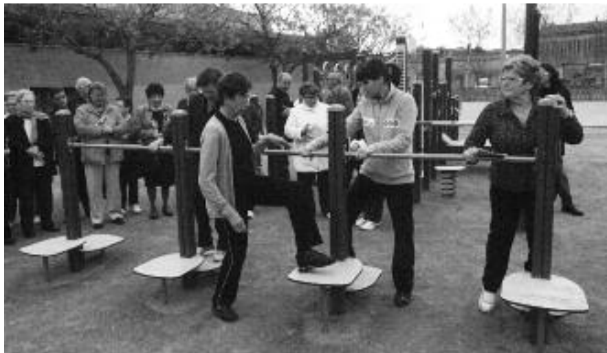
La monitora, al centre, aconsella dues usuàries com fer servir els aparells.

Una trentena de persones va seguir l'abril passat la primera sessió amb monitor al parc de salut de la zona esportiva de la Bisbal. La fisioterapeuta va mostrar als assistents com s'han d'utilitzar els aparells que s'han instal·lat al parc de salut. Els Parcs Urbans de Salut van dirigits a persones adultes a partir de 16 anys. Els exercicis previstos tenen un mínim impacte articular, estan pensats per millorar la higiene postural, amb moviments guiats i de fàcil execució per evitar riscos i tenen una transferència positiva a la vida diària.