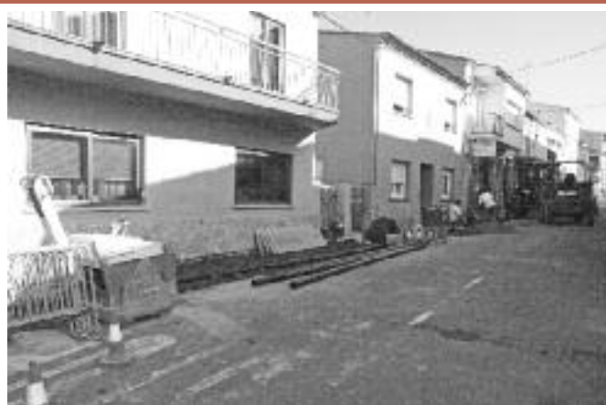
Urbanització puig de Sant Ramon. Sorea va iniciar el mes de maig els treballs del projecte de millora i soterrament dels serveis d'aigua potable, enllumenat públic, línies de baixa tensió i telefonia de la urbanització del puig de Sant Ramon, per un import de 1.517.509 €. Els treballs tenen una durada prevista de catorze mesos.