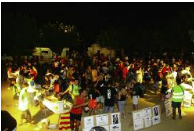
Caminada nocturna. La 13a Caminada Nocturna per les Gavarres, organitzada per l'associació juvenil ESPOC, va aplegar 1.200 persones i va batre el rècord de participants. El nombre d'inscrits l'any passat va ser de 900 persones i aquest any s'ha incrementat un 33%.