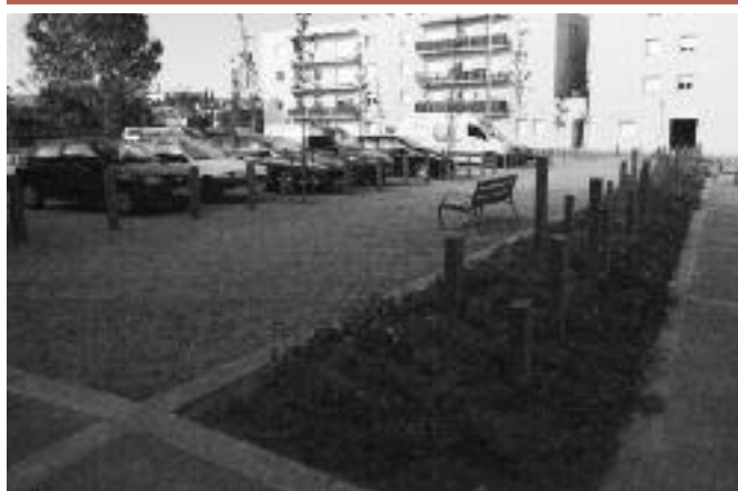
Plaça Pere Lloberas. S'hi han posat arbres i sauló, els serveis, les voreres i un nou enllumenat. A tocar del carrer Josep Irla s'hi ha fet una franja enjardinada amb bancs, papereres i una nova font. Aquesta és la primera de quatre zones verdes incloses al Pla Parcial de la Guardiola, valorades en 130.000 euros i que paga l'Incasol.

Les obres d'aquesta III Fase del nucli antic formen part del projecte del Pla de Barris que subvenciona en un 50% la Generalitat i en un 50% l'Ajuntament de la Bisbal i que té un pressupost de 8.155.000 €.