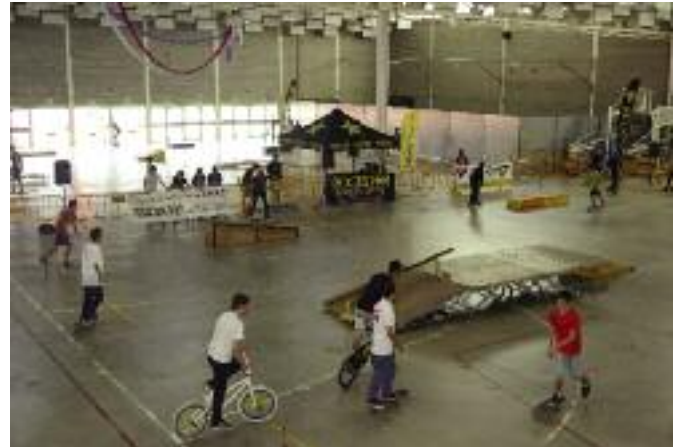
Bisbal Street Festival. Més 200 persones van participar a la primera edició del Bisbal Street Festival. Liderat per Ungravity i amb el suport de les àrees de Joventut i Educació de l'Ajuntament va tenir participació de públic divers en diferents esports de carrer com BMX, skate, inline i scooter.