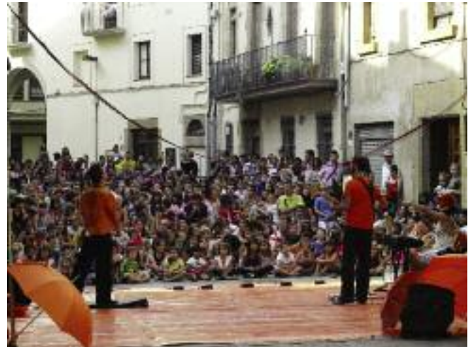
Fira de Circ. L'edició d'aquest 2011 de la Fira de Circ va aconseguir un nou èxit de públic i de qualitat dels espectacles programats. Es van estrenar dos nous espais escènics, al carrer Pella i Forgas –a la foto– i al camp dels Capellans i es va constatar una major aflluència de públic el primer dia.