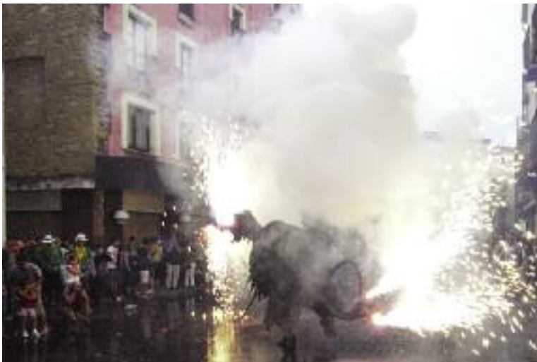
Festa Major. Cercavila. El temps va respectar força la Festa Major d'aquest 2011 però el dia de la Cercavila d'inici va caure un plugim que va fer encara més espectacular el foc. Això es va veure especialment a la plaça Major.