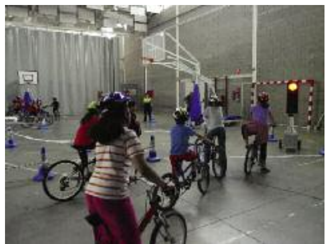
Jornades educació vial. L'Ajuntament va organitzar el maig passat unes jornades d'educació vial per als escolars de nou i deu anys. La Policia Local va muntar un circuit amb escenaris de trànsit real quan se circula en bicicleta.