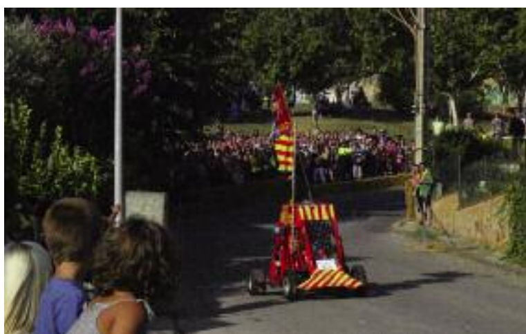
Festa Major. Voltour-ada. Una de les novetats d'aquesta Festa Major ha estat la Voltour-ada o baixada de carretons. Una vintena d'equips van construir el seu propi vehicle i van fer un parell de baixades a alta velocitat al circuit que havien preparat els Voltors i que va tenir molt bona acollida amb una nombrosa assistència.