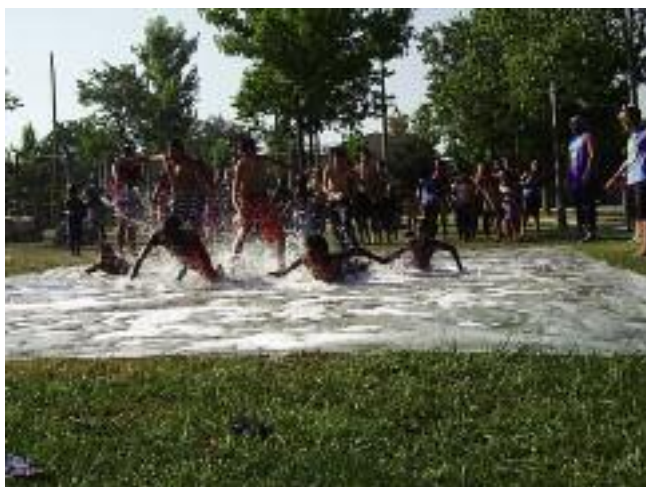
Estiu Jove. L'Ajuntament ha valorat molt positivament l'Estiu Jove 2011 organitzat per les regidories d'Educació i de Joventut pel bon resultat dels nous espais utilitzats i pel fet que s'ha assolit un rècord de participació, amb 940 persones.